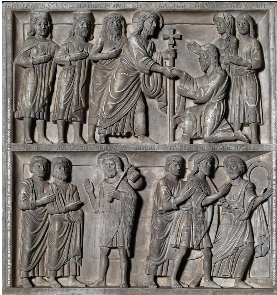
Guido da Como (1250) Gesù discende agli inferi / Apparizione ai discepoli di Emmaus, Chiesa di San Bartolomeo (Pistoia)

Come religiosa mi sento tanto responsabile di aver ricevuto la sua chiamata a seguirlo in una vita di totale consacrazione e, anche se con tantissima gioia nel cuore, mi rendo conto di essere fortemente inadeguata per corrispondere a tutto l'amore che Lui mi ha dato e continua a darmi. Confido immensamente nella sua infinita misericordia e in questa Settimana Santa voglio rinnovare, con la certezza del suo aiuto, l'impegno di testimoniare, ogni giorno, con tutte le mie povere forze.