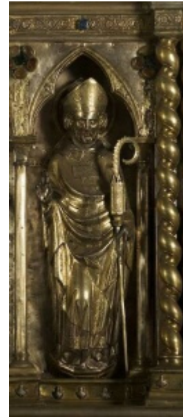
San Zeno, Altare Argenteo di San Jacopo, Cattedrale