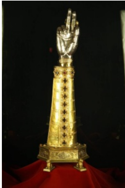
Enrico Belandini, Braccio-reliquiario di San Zeno (1369)