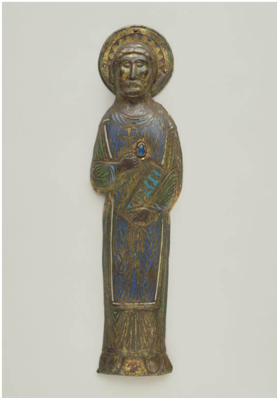
Effige di San Baronto , bronzo smaltato, XIII secolo, Allen Memorial Art Museum, Oberlin (Ohio)

Molti sono i segni di questa lunga permanenza del culto: in quest'occasione vorrei ricordarne almeno due. Le storie e le cronache antiche, come abbiamo visto, narrano che la fama dei miracoli avvenuti grazie all'intercessione dei Santi Baronto e Desiderio fu tale che prima le popolazioni vicine e poi quelle lontane fecero a gara a «correre qua ad invocare e venerare i sacri corpi dei santi ivi sepolti. Fin dalla Francia, dicono le cronache sarebbero venute qui [...] turbe di pellegrini». Fino alla fine del XIX secolo di questo antico splendore rimaneva una traccia: si trattava di sei statuette raffiguranti S. Baronto e i suoi compagni eremiti . Erano -scriveva A. Mazzanti nel 1920- «graziose, pregevoli, antichissime