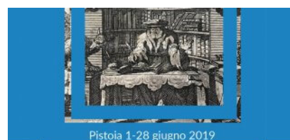
Pistoia 1-28 giugno 2019

Nell'ambito dell'iniziativa Aperti al MAB, dedicata alla valorizzazione del patrimonio culturale di musei, biblioteche e