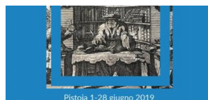
Pistoia 1-28 giugno 2019 Nell'ambito dell'iniziativa Aperti al MAB, dedicata alla valorizzazione del patrimonio culturale di musei, biblioteche e